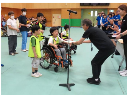
「スターエイト・アルタイル」チーム