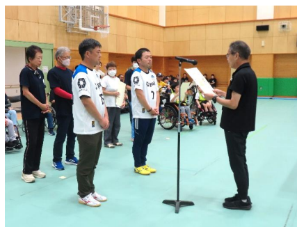
No.2 「フライハイト栃木」チーム