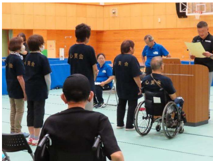
「いちかい心笑会」チーム