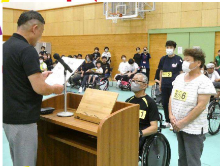
No.1 「宇肢会 A」チーム