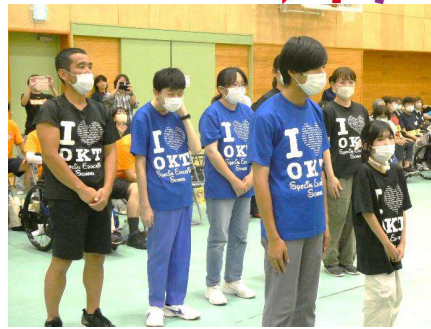
No.2 「OKT(岡本特別支援学校)」チーム