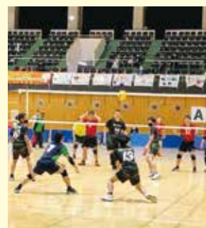
バレーボール（知的・男子）