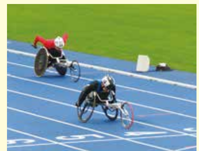
陸上競技（車いすレーサー）