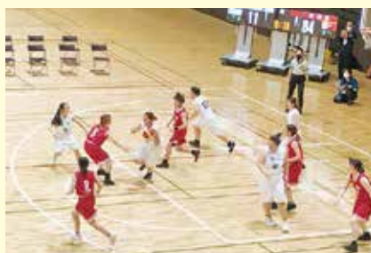
バスケットボール女子