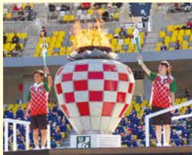
開会式(炬火点火) 炬火最終ランナー:左から数度選手、日野選手