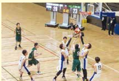
バスケットボール男子