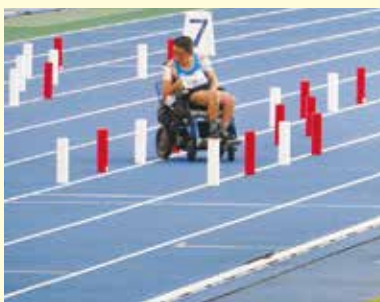
陸上競技（スラローム）