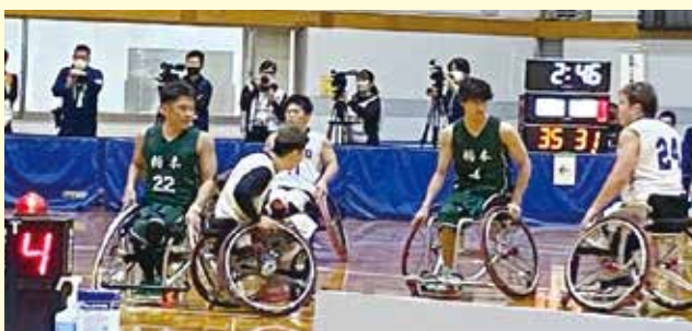
車いすバスケットボール