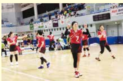
バレーボール（聴覚・女子）