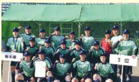
フットソフトボール 3位