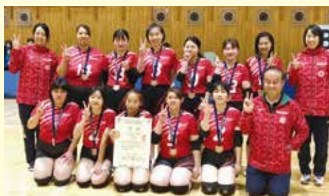
バレーボール（知的・女子） 3位