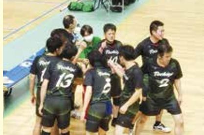
バレーボール（聴覚・男子）