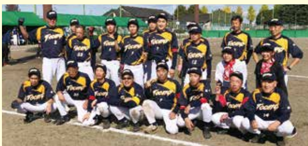
グランドソフトボール