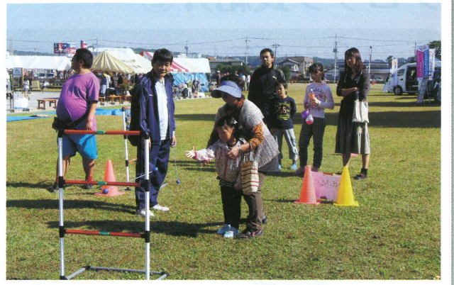
カルフルとちぎ・ラダーゲッター体験