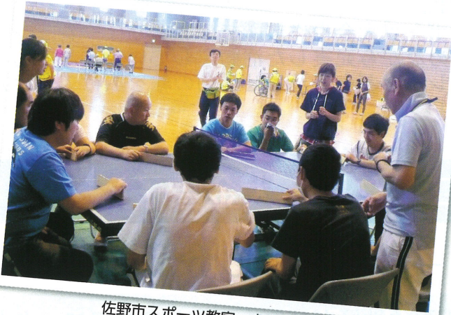
佐野市スポーツ教室・卓球バレー