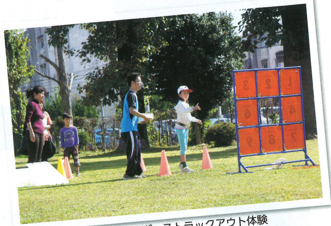
カルフルとちぎ・ストラックアウト体験