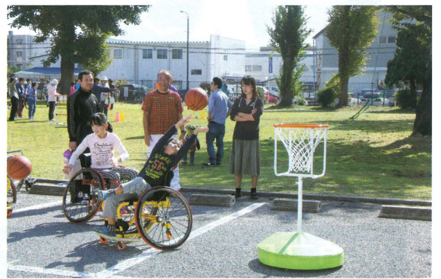
カルフルとちぎ・車椅子バスケットボール体験