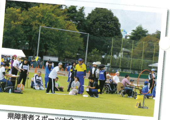
県障害者スポーツ大会・フライングディスク