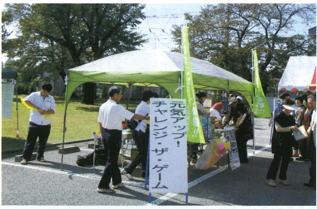
カルフルとちぎ・パネル展示