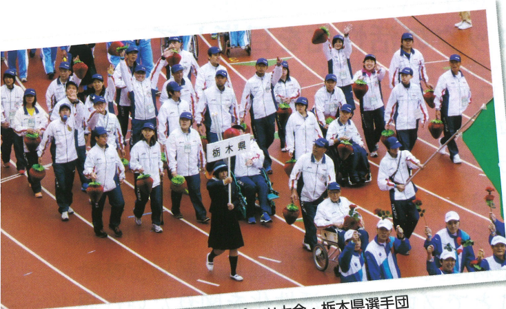
第14回全国障害者スポーツ大会・栃木県選手団