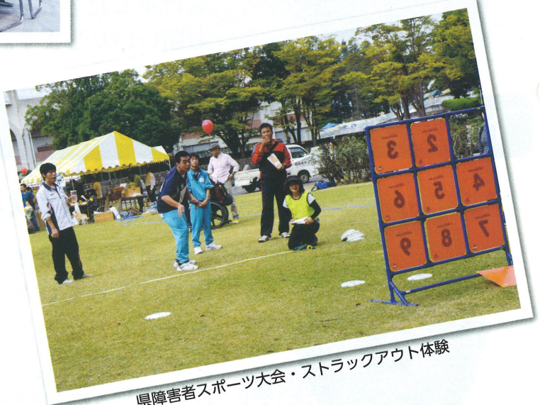
県障害者スポーツ大会・ストラックアウト体験