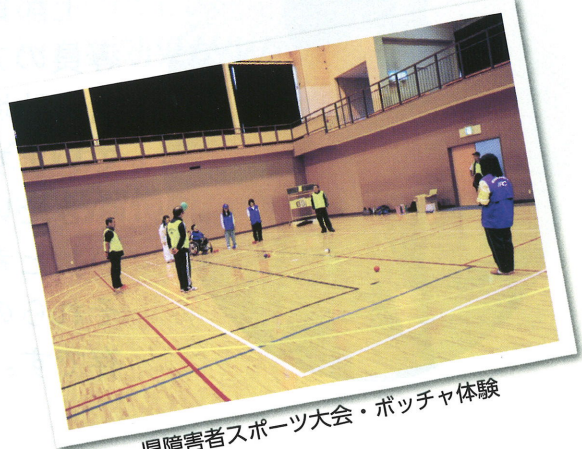
県障害者スポーツ大会・ボッチャ体験