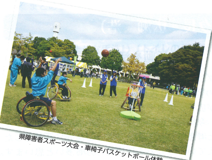
県障害者スポーツ大会・車椅子バスケットボール体験