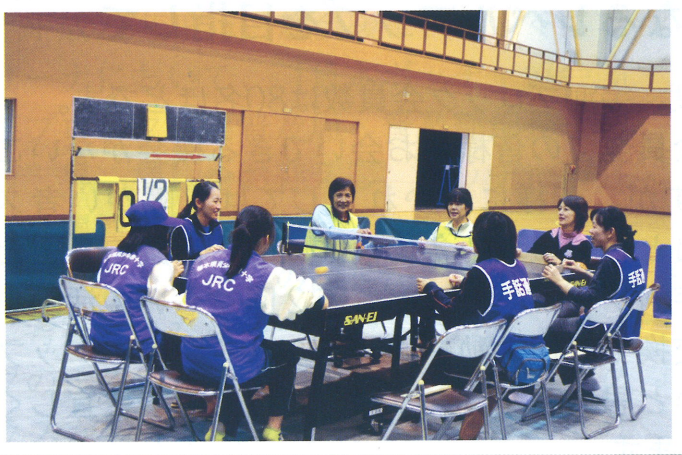
県障害者スポーツ大会・卓球バレー体験