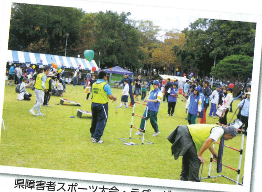
県障害者スポーツ大会・ラダーゲッター体験