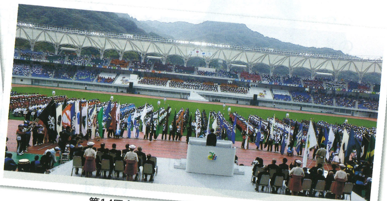
第14回全国障害者スポーツ大会・開会式