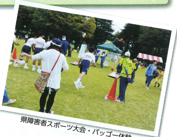
県障害者スポーツ大会・バグジー体験