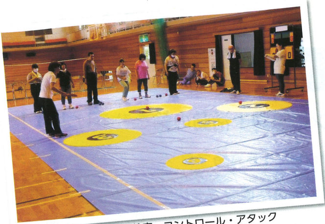
益子町スポーツ教室・コントロール・アタック