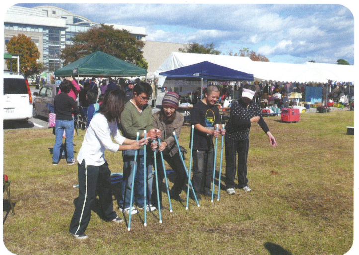
キャッチ・ザ・スティック