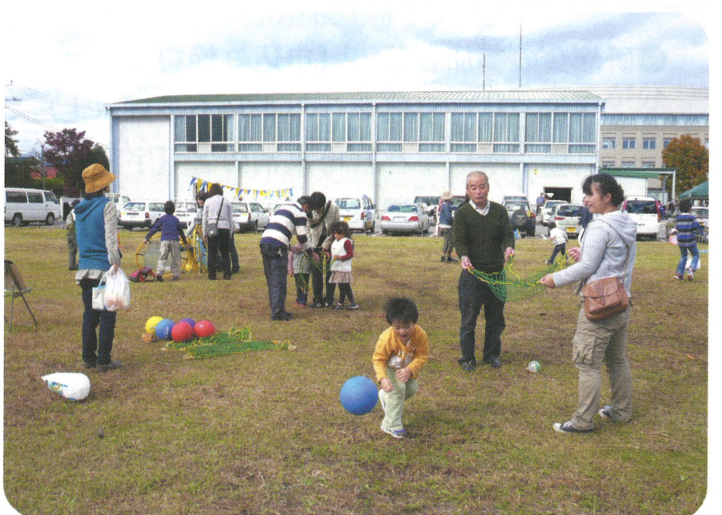
ネットパスラリー

向かい合ったペアが3つ以上のリングをまとめて投げあい、トータルで何個キャッチできたかを競う。