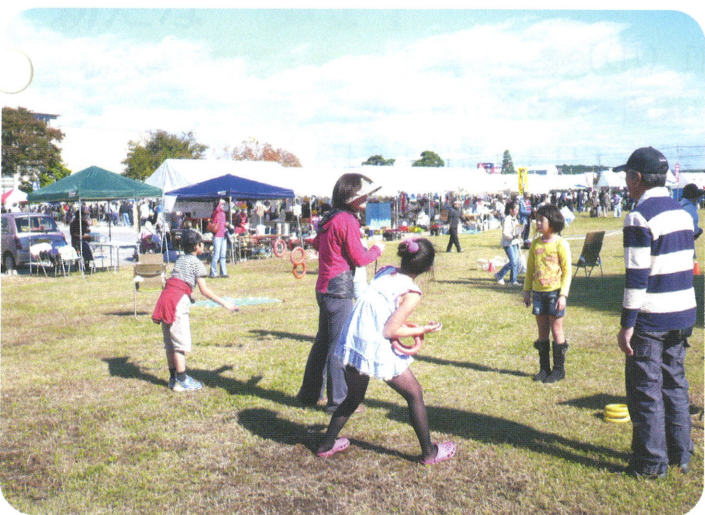
ペアリングキャッチ

向かい合ったペアが3つ以上のリングをまとめて投げあい、トータルで何個キャッチできたかを競う。