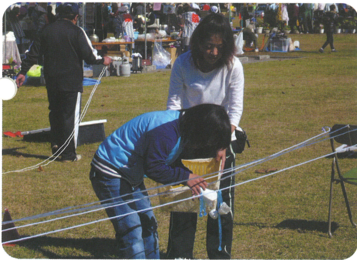
あした天気にな〜れ！（創作ゲーム）