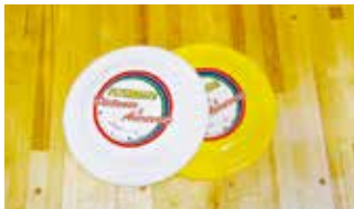
フライングディスク