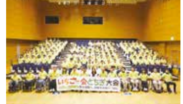
令和元(2019)年度 任命式