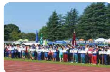
第13回大会 開会式の様子