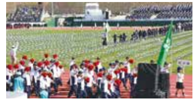
第18回全国障害者スポーツ大会(福井大会)