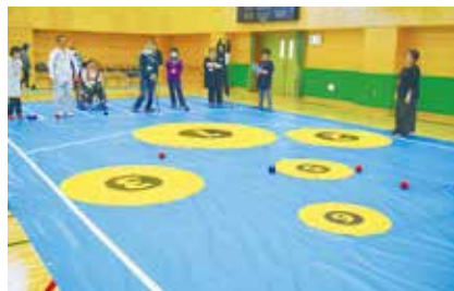
コントロール・アタック教室

令和2(2020)年2月23日(日)に開催しました。教室の中で、ランダムにチームを編成し、試合形式を実施しました。参加者が競技を楽しんでいる姿をみることができました。