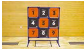
ストラックアウト