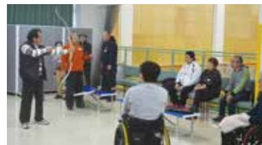
アーチェリーの様子