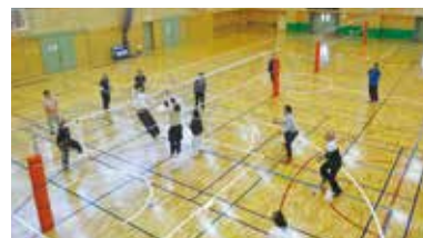
バレーボール体験会の様子

バスケットボール(知的・男女)、バレーボール(聴覚・男女、知的・男女)、サッカー(知的)、ソフトボール(知的)、フットベースボール(知的)の5競技について、定期的に強化練習会を実施しました。