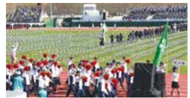
第18回全国障害者スポーツ大会(福井大会)