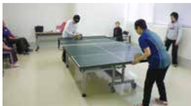
サウンドテーブルテニスの様子